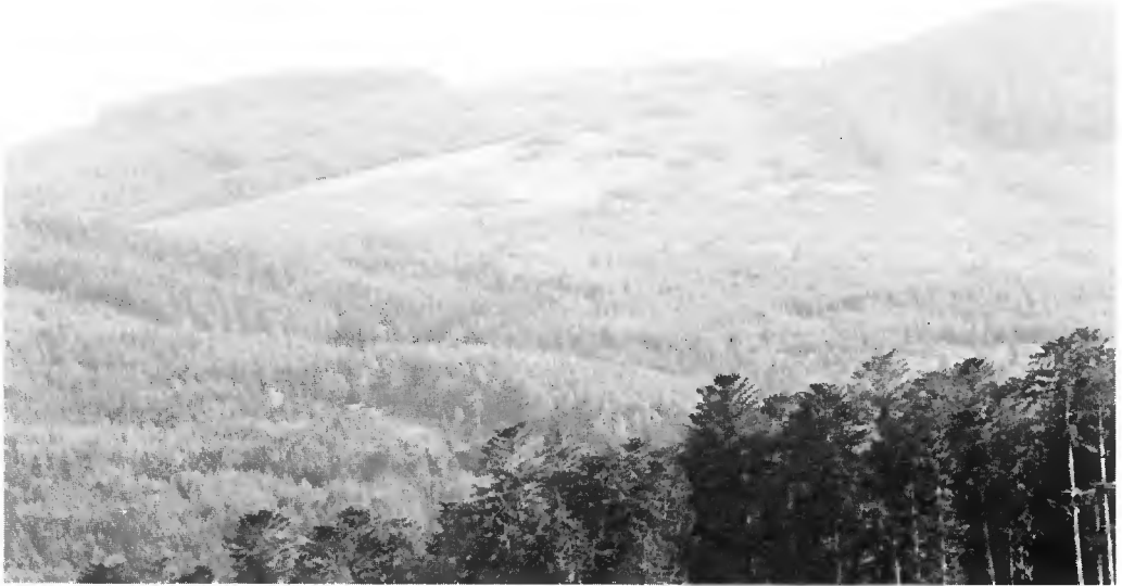
Coupe à blanc, jeunes peuplements uniformes, reliquats de vieux peuplements insuffisants au maintien du Tétrás. Forêt d'Obernai (Bas-Rhin).

Schatt [13] mentionne à juste titre les effets bénéfiques de grandes renversées de chablis : elles ouvrent des massifs fermés et multiplient les lisières. Cependant, le « nettoyage » rapide de ces zones leur fait à nouveau perdre tout intérêt.