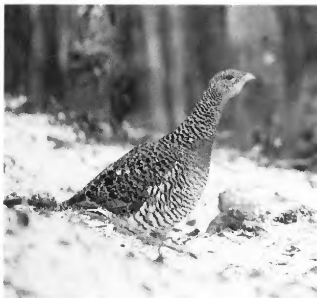
Grand Coq au chant (à gauche). Poule de Bruyère (à droite), Hautes-Vosges.