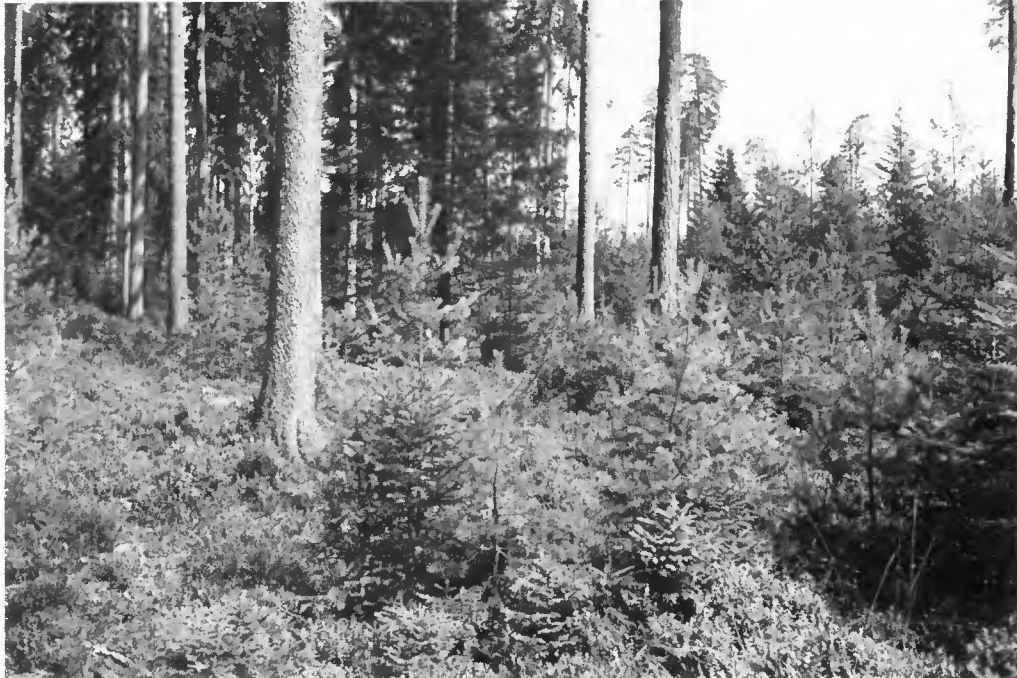
Régénération en « coins » (Keilschirmschlag) d'un peuplement de Sapin, Epicéa, Pin (Hêtre), offrant des lisières favorables au Tétrás. Forêt communale de Villingen (Forêt-Noire).