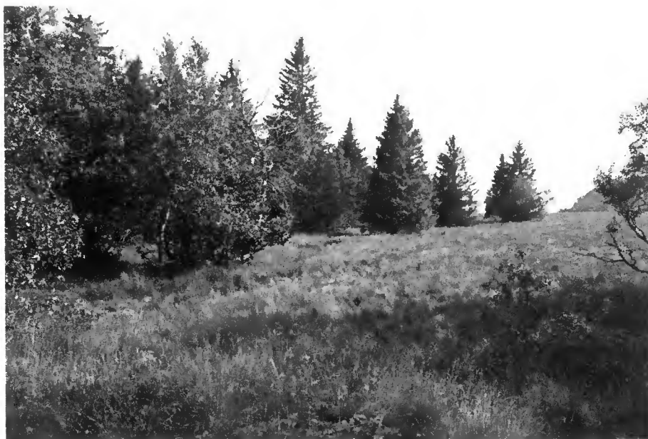
Prés-bois. Peuplement lâche offrant de nombreuses lisières Hautes Chaumes.

Ce biotope est aujourd'hui encore fréquenté par le Tétrás mais, par rapport au siècle dernier, il s'est restreint en surface du fait des plantations d'Epicéa.