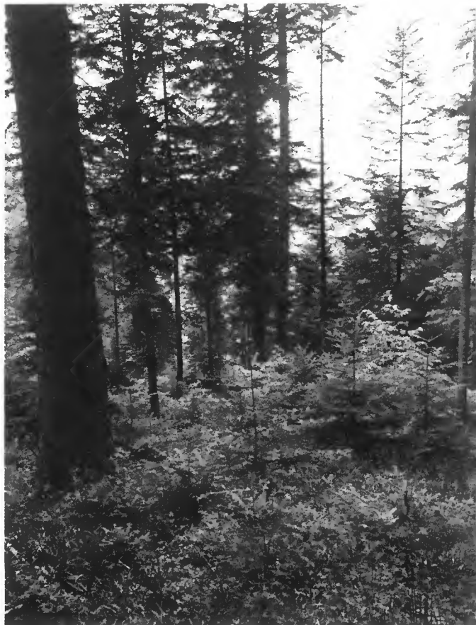
Hêtraie-Sapinière. Futaie en régénération. Le stade favorable au Tétrás.

La détérioration de ce biotope peut provenir, soit de l'apparition de formes de hêtraie-sapinière défavorables au Tétrás, soit de sa disparition au profit de peuplements monospécifiques.